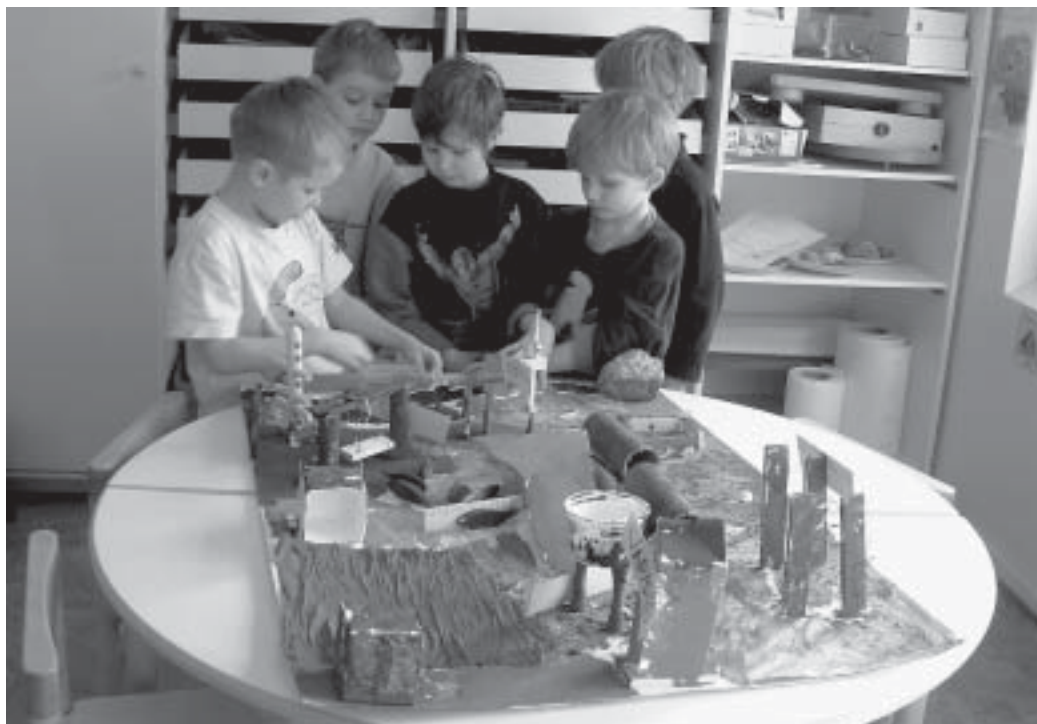
Lampipuiston päiväkodin lapset osallistuivat Lastu-työhön ja suunnittelivat toiveitten pihan.

”Lapset tekivät malleja innoissaan ja miettivät, miten kaikki saataisiin mahtumaan oman päiväkodin pihalle. Joku arveli, että kaiken saamiseen tarvitaan rahaa ja että sitten pitäisi mennä päättäjien puheille.”