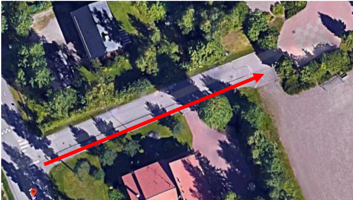
Kuva 2. Kuljetusten lähtö- ja jättöpaikka Vihtakadun koululla

Kuljetukset lähtevät arviolta n. 15 minuuttia ennen koulun alkua ja n. 15 minuuttia koulupäivän päättymisen jälkeen. Linja-autojen lastausaika on 15 minuuttia ennen lähtöaikaa ja kuljetukset lähtevät sovittuna aikana. Alkuvaiheessa koulun henkilökuntaa on opastamassa kuljetusten lähtöpaikoilla. Huoltajat huolehtivat aamulla, että oppilas saapuu ajoissa lähtöpaikalle.