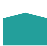
loiva harjakatto 1:4