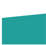
loiva pulpettikatto 1:10