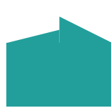
murrettu harjakatto, 1:4 ja 1:2