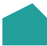
epäkeskeinen harjakatto, 1:2 ja 1:1