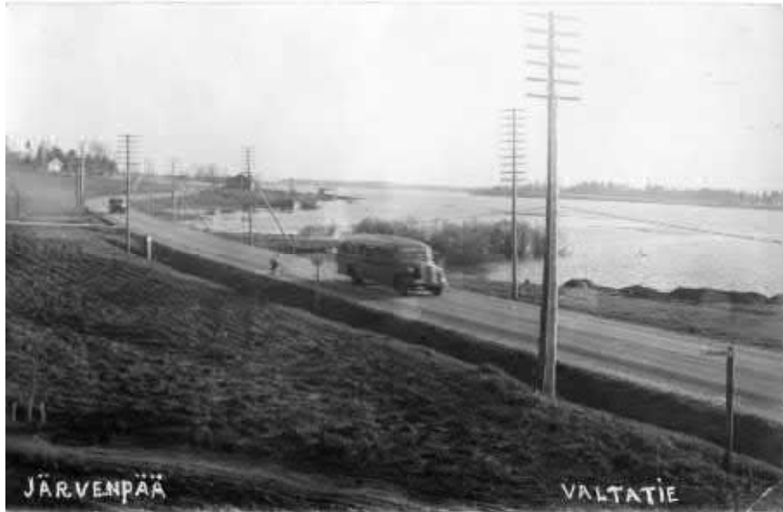
Kevättulva Rantatiellä vuonna 1942.