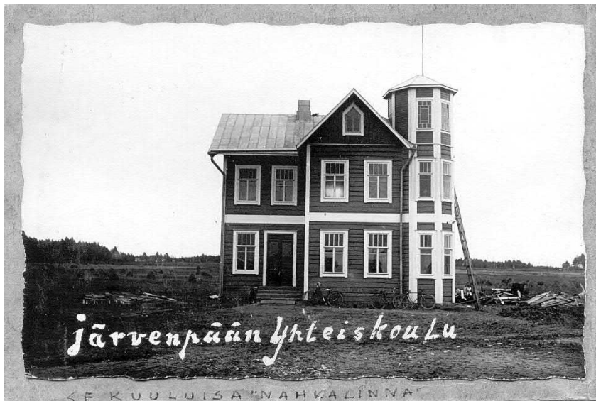
Järvenpään Yhteiskoulu aloitti toimintansa Kannakselta tuodussa "Nahkalinnassa" vuonna 1928. Nahkalinna purettiin vuonna 1953.

Järvenpään kartanon maiden siirryttyä 1925 valtion omistukseen, perustettiin sen maille valtion oppilaitoksia, kuten emäntäkoulu, kotitalousopettajaopisto ja maatalousnormaalikoulu. Invalidiliiton oppilaitostoiminta Järvenpäässä alkoi 1948 Invalidiliiton hankittua Mannilantien varrelta 1920-, 30- ja 40-luvulla rakennetut teollisuusrakennukset. Alueelle rakennettiin lisää jo 1950-luvulla. Nykyisin Invan oppilaitostoiminnasta vastaa Validia Ammattiopisto.