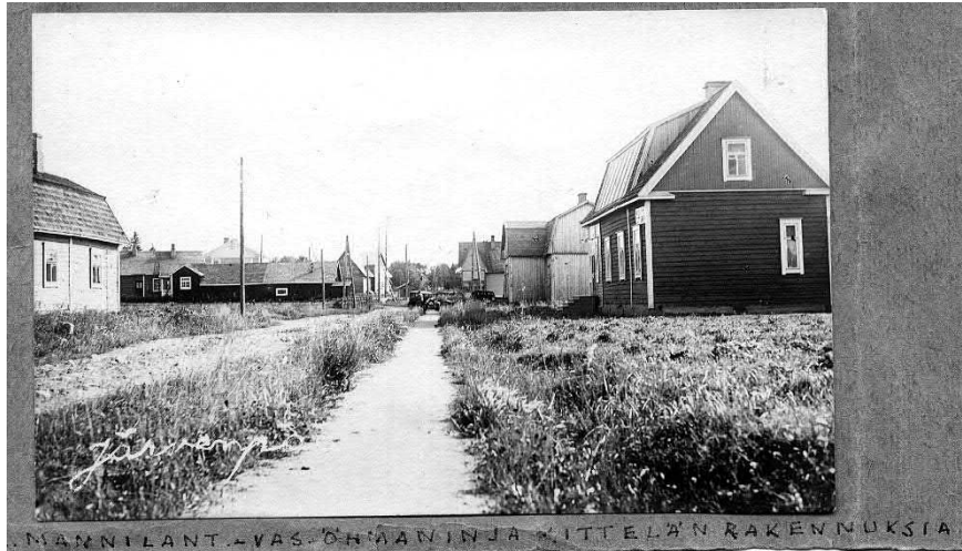
Mannilantietä 1920-luvulla.