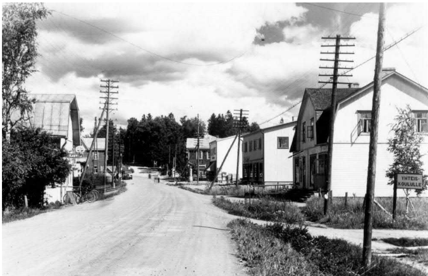
Sibeliuksenkatua 1940-luvulla.