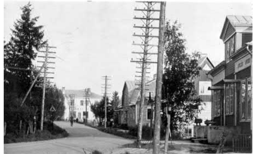
Sibeliuksenkatua apteekin kohdalta Lehtosen kaupalle päin 1930-luvulla. Vanha apteekki, kuvassa oikealla, on esimerkki 1920-luvulla Terijoelta tuodusta huvilasta Järvenpään vanhimmassa keskustassa. Nykyisin ravintola Huvilana tunnettu rakennus (tässä julkaisussa kohde O6.02) on suojeltu asemakaavalla.