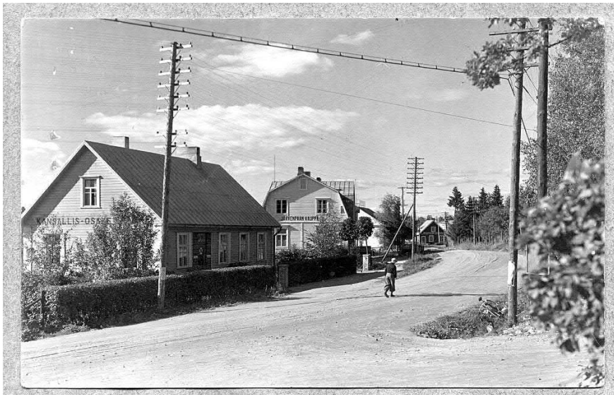
Sibeliuksenkatua 1920-luvulla.