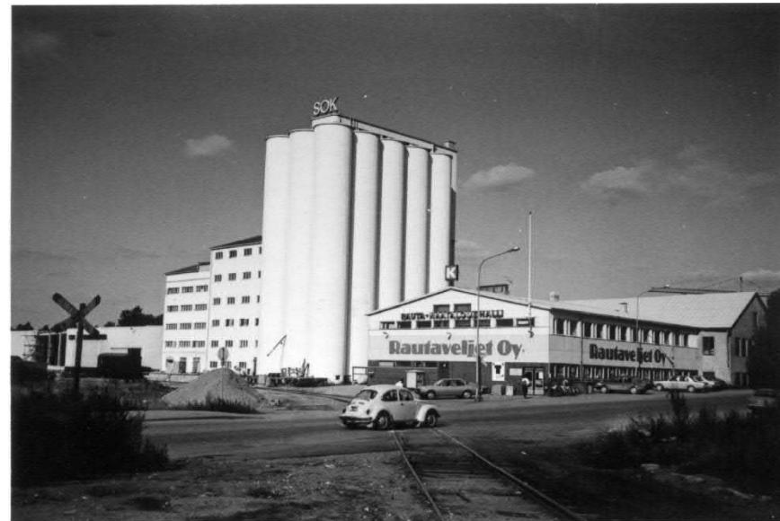
Mylly Pajalan maamerkinä. Rakennus on nykyisin korvattu teollisuusperintöä ilmentävällä uudella asuinrakennuksella.