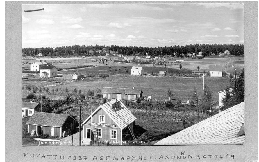
Järvenpään keskustaa 1937.