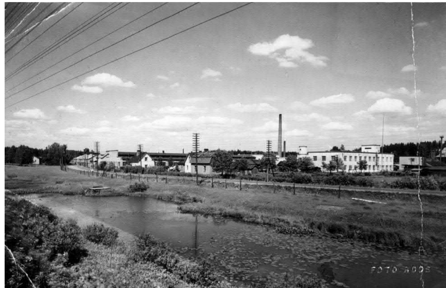
Pajalaa 1900-luvun alkupuolella.