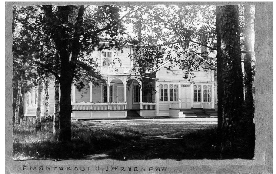
Järvenpään kartanon vanha päärakennus, jossa 1925-1950 toimi emäntäkoulu.