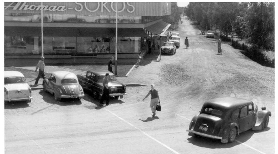
Sibeliuksenkadun ja Ahomaa-Sukosin kulma 1960-luvun paikkeilta.