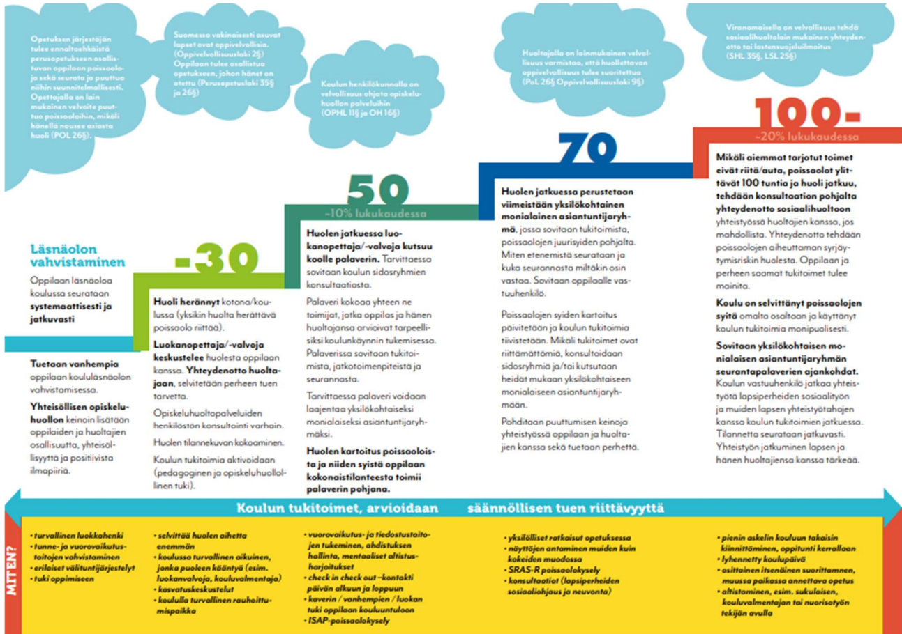
Kuva: Toimintamalli oppilaan poissaolotilanteissa

Kouluissa oppilaiden läsnäoloa pyritään vahvistamaan yhteisöllinen opiskeluhoollon keinoin. Koulun kiinnittymistä pyritään tukemaan mm. tunne- ja vuorovaikutustaitojen tukemisella. Koulun kiinnittymisen apuna on suunnitelmallinen poissaolotietojen seuranta. Yhteisöllinen opiskeluhoolloryhmä seuraa poissaoloja luokkatasoisesti. Yhteisöllinen opiskeluhoolloryhmä käy läpi koulun poissaolotilatot luokkatasoisesti syysloman ja talviloman jälkeen. Seurannan tarkoituksena on hyödyntää tietoa yhteisöllisen opiskeluhoollon toimintojen suunnittelussa ja kohdentamisessa poissaolojen ennaltaehkäisemiseksi ja niihin puuttumiseksi.